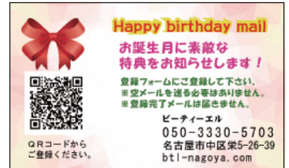
店頭配布用 (名刺サイズ) カードB